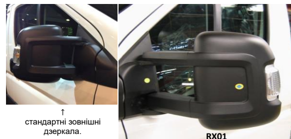
↑ стандартні зовнішні дзеркала.